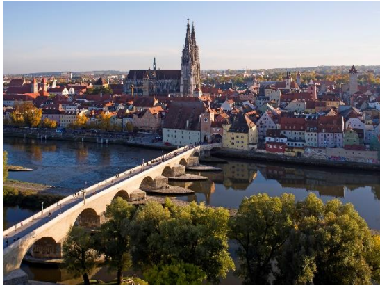
Stadt Regensburg UNESCO Welterbe