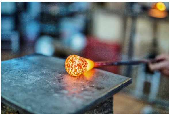
25 Jahre Glasstraße - Glasherstellung