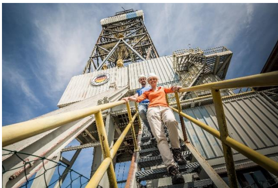
Oberpfälzer Radl-Welt Geo Zentrum an der KTB

https://www.rottal-inn.de/wirtschaft-tourismus/tourismus/rottaler-hoftour/