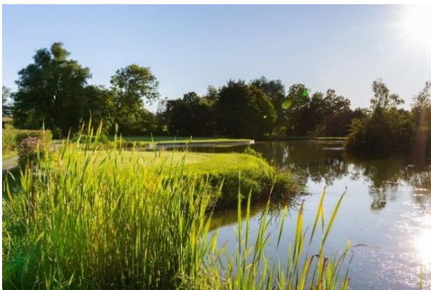
Golfplatz Sagmühle Bad Griesbach

Toleranz, geschaffen aus Stahl und Lamberts-Glas aus Waldsassen wird am Grenzübergang enthüllt. Festprogramm: https://www.oberpfalz.de/europawoche-waldsassen/