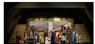
Passionsspiele Neumarkt i.d.OPf

100 Jahre Passionsspiele Neumarkt Vom 25.-27.03.2022 finden im Münster Sankt Johannes in Neumarkt i.d.OPf. die Passionsspiele Neumarkt in einer einstündigen, gekürzten Fassung statt. http://www.passionsspiele-neumarkt.de/