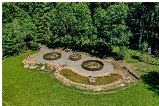
Reptiliengehege Drohnenaufnahme Nationalpark Bayerischer Wald

Der längste und vielfältigste Wanderweg Deutschlands feiert ein kleines Jubiläum: Der Goldsteig wird 15 Jahre alt. Der 660 Kilometer lange Hauptweg ist vom Deutschen Wanderverband durchgängig als Qualitätswanderweg zertifiziert. Ein weites Netz aus Rundwegen, Zuwegen, Alternativrouten, grenzüberschreitenden und historischen Routen ergänzt den Goldsteig auf über 2.000 Kilometern Wandervergnügen. https://www.goldsteig-wandern.de/