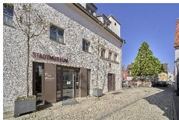
Stadtmuseum Neumarkt i.d.OPf_