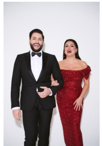
Anna Netrebko & Jusif Eyvazov

Die Thurn und Taxis Schlossfestspiele finden 2022 vom 15. bis 24. Juli 2022 in der zauberhaften Atmosphäre von Innenhof und Park des Fürstlichen Schlosses in Regensburg statt. Karten gibt es ab sofort unter www.odeon-concerte.de und telefonisch im Festspielbüro unter Tel. (0941) 29 60 00 sowie an allen bekannten Vorverkaufsstellen von Eventim und myticket.