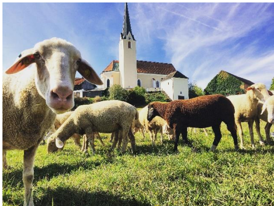
Rottal Hoftou rPostmünster Gutshof Poltin

https://www.bodenmais.de/service/bodenmaiser-gschichten/almabtrieb/