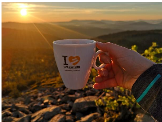
Goldsteig_Abenteuer und Freiheit_Sonnenaufgang Lusen_Tasse