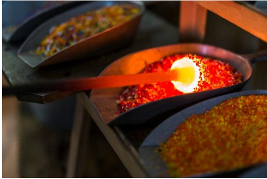
Glaskölbl in der Glashütte