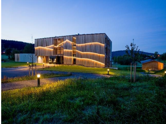
1(c) Landgasthof und Naturhotel Euler Neuschönau, Foto Daniela Blöching