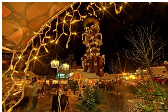
Weihnachtsmarkt am Kuchlbauer Turm - ein Hundertwasser Architekturprojekt, geplant und bearbeitet von Architekt Peter Pelikan