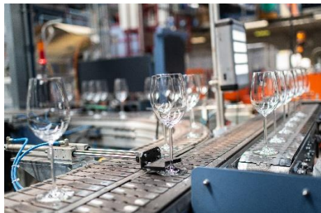
Zwiesel Kristallglas Glasstraße