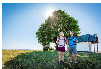
Dreifaltigkeitskapelle bei Muglhof