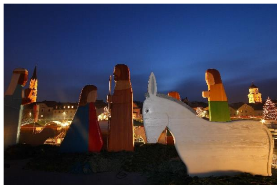
Vilshofen_Schwimmender Christkindlmarkt_Brettkrippe_(c) Tourist-Info Passauer Land