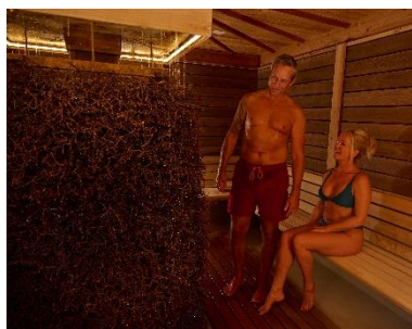
AeroSalzum_Europatherme_Bad Füssing_(c) TVO, Gerhard Illig

Regensburg (tvo). Winterzeit ist Wellnesszeit. Wenn es draußen stürmt und schneit, bieten die Thermen Im Bayerischen Golf- und Thermenland herrliche Entspannung und wohltuende Wärme für Körper und Seele. Die „Gesunden Fünf“ Bad Füssing, Bad Griesbach, Bad Birnbach, Bad Gögging und Bad Abbach versprechen genussvolle Erholung auf mehr als 20.000 Quadratmetern Wasserfläche. Gesundes Schwitzen trägt zudem zur Stärkung der körpereigenen Abwehrkräfte bei – zum Beispiel im neu eröffneten Römer-Turm, im türkischen Hamam oder in Europas einziger Kartoffel-Sauna. www.bayerisches-thermenland.de