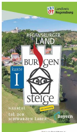
Karte Burgensteige

Zu den Regensburger Burgensteigen sind neue und kostenlose Wanderkarten mit vielen Hintergrundinformationen, integrierten Rundtouren für Tageswanderungen und Service-Tipps erschienen. Sie sind als Druckversion oder PDF erhältlich unter www.landkreis-regensburg.de