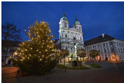
Basilika Waldsassen Weihnachtszeit