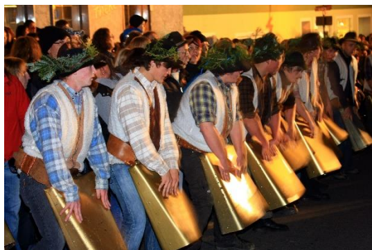
Wolfauslassen in Rinchnach