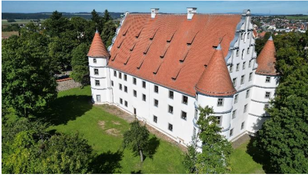
Schloss Friedrichsburg Vohenstrauß