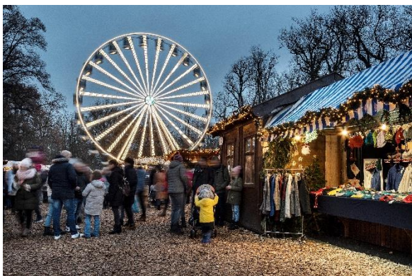
Christkindlmarkt Ringlstecherwiese

Romantisch, künstlerisch oder traditionell – mit sechs Christkindlmärkten an den besten Locations der Stadt bietet Regensburg in der Adventszeit ein großes Angebot an Leckereien und attraktiven Ständen. Nach der Sightseeingtour kann man entspannt von Markt zu Markt bummeln, hier eine Tasse Glühwein trinken, dort eine Leckerei kosten, handgemachten Weihnachtsschmuck kaufen und Kleinigkeiten für unter den Christbaum auswählen. Termine und Infos unter www.tourismus.regensburg.de