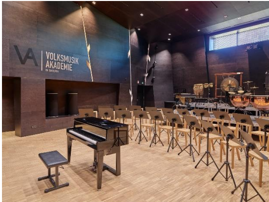
Volksmusikakademie in Bayern Freyung