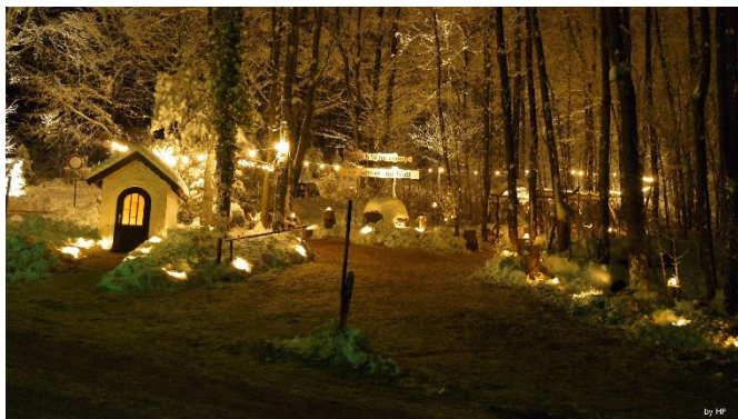
Weihnachtsmarkt am Eulenberg

einem Dach vereinen? Der historische Langstadl im Herzen Freyungs bietet mit 7:000 Quadratmetern und 15 klang- und schalloptimierten Proberäumen genug Platz für alle. Unter dem Dach der „Volksakademie in Bayern“ kommen Volksmusikanten, Sänger und Tänzer zusammen. Ein großer Probensaal, der "Schwarze Bua", mit besten akustischen Bedingungen auch für große Blasorchester rundet das Angebot ab. Übernachtungsgästen bietet die Akademie 24 neue Zimmer mit insgesamt 96 Betten. Dazu gibt es einen kulinarischen Rundum-Service mit Produkten und Spezialitäten aus der Region. Einmal im Monat lädt die „Volksmusikakademie in Bayern“ in den Gewölbesaal zum gemütlichen Treffen mit Musik und kleinen Brotzeiten ein. Der Eintritt kostet für jeden Erwachsenen ein Stricherl auf dem Bierdeckel, Kinder sind frei. Weitere Infos und Seminarprogramm unter www.volksmusikakademie.de .