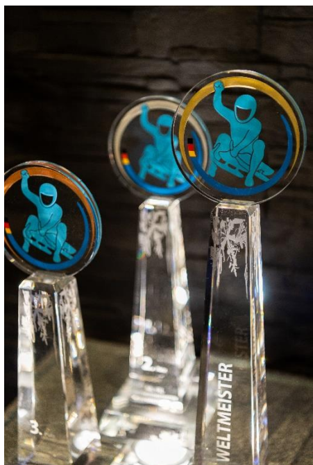
Joska Kristall Glasstrasse

Das Original aus Zwiesel erkennt man schon am Klang. Seit mehr 150 Jahren wird in niederbayerischem Zwiesel hochwertiges Glas produziert. Handgefertigte Gläser für besondere Anlässe und preisgekrönte Serien für ästhetisch genussvollen Alltag gehören heute zum Sortiment des Weltmarktführers. In seinem Werksverkauf bietet er eine große Auswahl an hochwertigen Kristallgläsern, Geschenken aus Glas sowie Sommelier- und Wohnaccessoires. www.zwiesel-glas.com