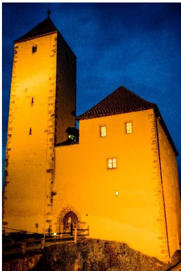
Burg Trausnitz bei Nacht