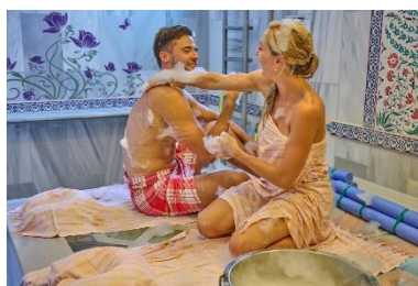
Entspannen im Hamam_Wohlfuehltherme_Bad Griesbach

Die Thermen in Bad Füssing haben mit ihrem Thermalwasser ein regelrechtes Wundermittel gegen Stress, chronische Schmerzen und vieles mehr parat. Ob Champagnerbecken, Sprudelpool, Strömungskanal oder Entschleunigungsbad mit Unterwassermusik – hier ist Wasser Trumpf und das in jeglicher Form. Saunaliebhaber kommen im Saunahof auf ihre Kosten. Die Kartoffelsauna verbirgt sich auf über 200 Quadratmetern in einem Raum, der historischen Kartoffelkellern nachempfunden wurde. Der „Kräuterhexen-Aufguss“ hingegen bringt die Besucher der Hexensauna ganz schön zum Schwitzen. Folgt man dem erdigen Duft von Wald und Feld, gelangt man zielsicher zur „Jagasauna“ und das AeroSalzum der Europa-Therme verspricht dank salzhaltiger Luft Meerfeeling mitten in Bayern. www.badfuessing.com