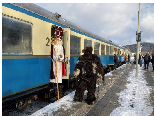
Unterwegs mit der Wanderbahn im Regental