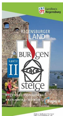
Karte Burgensteige