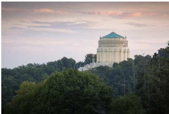
Befreiungshalle Kelheim

Die Angebote sind glaubensneutral und sowohl für geübte wie auch für Anfänger geeignet. Ab Mai kann man sich für meditative Führungen bei Vollmond, Ein-Klang-Meditationen oder die meditative Führung "heilende Steine" kostenpflichtig anmelden unter www.schulerloch.de .