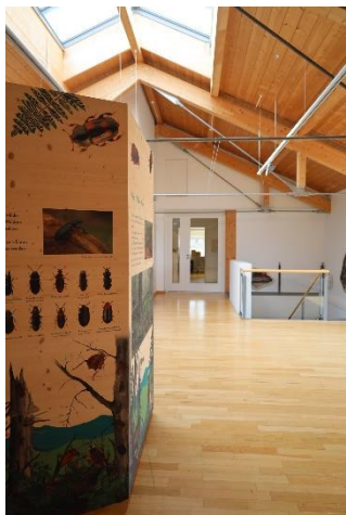
Käferausstellung_Spiegelau_fnbw_np_(c) _Lisa Schuster