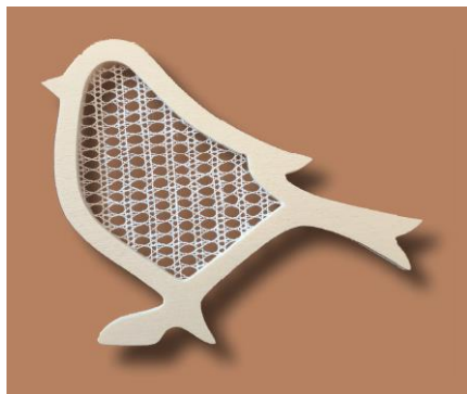
Klöppelarbeit Vogel