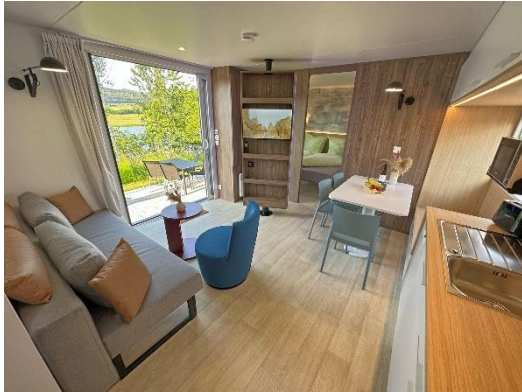
Tiny Chalet im Feriendorf Seeblick Neunburg v. Wald