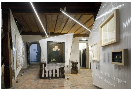
document Kepler

Amberg (tvo). Der Winterkönig, das war Friedrich V., geächteter Kurfürst von der Pfalz, böhmischer König ohne Reich, Verlierer der Schlacht am Weißen Berg. Man schreibt das Jahr 1632. Im Stück „Der Herbst des Winterkönigs“ begibt sich der Winterkönig in seine Geburts- und vormalige Residenzstadt Amberg. Das Amberger Welttheater erzählt nun die alte Geschichte in neuer Inszenierung auf dem neuen Festspielplatz, dem ehemaligen Landesgartenschauengelände in Amberg, vom 30. Mai bis 15. Juni in elf Aufführungen. Tickets ab 27 Euro sind erhältlich unter www.welttheater.amberg.de .