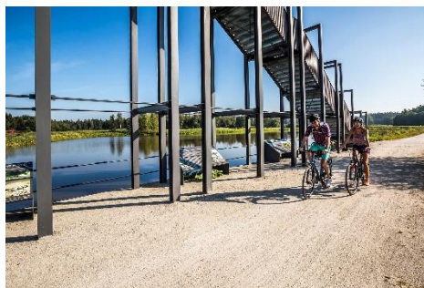
Oberpfälzer Radl-Welt Radler an der Himmelsleiter bei Tirschenreuth

Im Schönseer Land wird das Spitzenklöppeln bis heute kultiviert und die Leidenschaft für die „Kunst mit Garn“ bei Veranstaltungen an Gleichgesinnte und neugierige Anfänger weitergereicht. Zum fünften Mal lädt die oberpfälzer Spitzenstadt vom 22. bis 28. Mai 2024 zu den Schönseer Klöppeltagen mit Klöppelausstellungen unter anderem im Centrum Bavaria Bohemia und neun Klöppelkursen ein. Für alle, die das alte Kunsthandwerk einmal ausprobieren möchten, findet heuer erstmalig ein dreitägiger Schnupperkurs statt. www.vg-schoensee.de