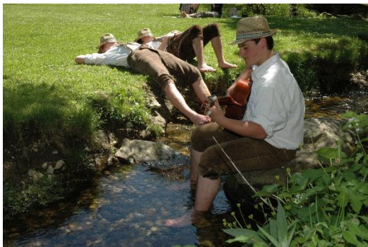
Musiker am Bach_Drumherum

Innenhof des Straubinger Herzogsschlusses rund 200 Amateurdarsteller und Mitwirkende das Drama um Agnes Bernauer und Herzog Albrecht III. mit einer Neuinszenierung auf die Bühne. Das neue Stück stammt aus der Feder des Regisseurs und Drehbuchautors Thomas Stammberger. Auch wenn man das Festspiel bereits gesehen hat: ein Wiederkommen lohnt sich. Denn die überarbeitete Vorlage berücksichtigt aktuelle Forschungsergebnisse und setzt auf zeitgemäße und emotional berührende Dramaturgie. Die Agnes-Bernauer-Festspiele sind eines der größten Freilichtspiele Bayerns mit bis zu 20.000 Besuchern. Sie finden alle vier Jahre statt. Termine und Tickets ab 28 Euro unter www.agnes-bernauer-festspiele.de .