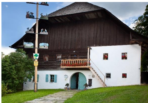
Das Schramlhaus, Freyung

begann. Bleikristall ist glattes oder geschliffenes Bleiglas, aus dem unter anderem hochwertige Gläser und Vasen gefertigt werden. Auch wenn die Bleikristall-Produktion inzwischen stillsteht: Beindruckende Exponate im Stadtmuseum zeugen bis heute von der Geschicklichkeit und Kunstfertigkeit der Neustädter „Gloserer“. Prunkstück der Sammlung ist die über einen Meter hohe Überfangvase in Goldrubin. Faszinierend ist auch das Musterstück einer sehr exklusiven Schale, die weltweit nur drei Besitzer kennt: die Erben von Franz Josef Strauß, das jordanische Königshaus und die Familie Frank. Eine weitere Sehenswürdigkeit ist das Neue Lobkowitz-Schloss mit Barockgarten am Stadtplatz. www.neustadt-waldnaab.de