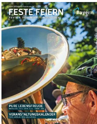
Broschüre Feste und Veranstaltungen 2024