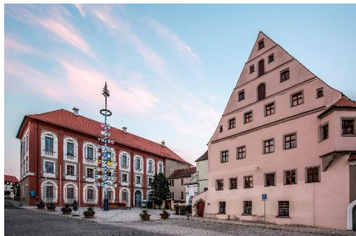
Lobkowitzschlösser in Neustadt a.d. Waldnaab