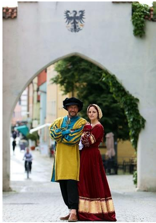
Neumarkter G'schichtswandler_(c) Amory Salzmann Fotografie

Neumarkt i.d.OPf. (tvo). Rundgang zu historischen Stätten jüdischer Vergangenheit Neumarkts? Verwinkelt und versteckt – Auf neuen Pfaden durch die Altstadt? Bei den "Sonntagsführungen für jedermann" nehmen Neumarkter Gästeführer neugierige Besucher auf Streifzüge durch die alte Pfalzgrafenstadt zwischen Regensburg und Nürnberg. Auch an anderen Tagen der Woche sind Führungen zu einem bunten Strauß an Themen und Persönlichkeiten buchbar, darunter die kulinarische Stadtführung „Wie schmeckt meine Stadt?“ am Samstag, den 20. April 2024 oder „Auf den Spuren von Pfarrer Kneipp“ am Dienstag, den 14. Mai 2024. Termine und Anmeldung unter www.tourismus-neumarkt.de