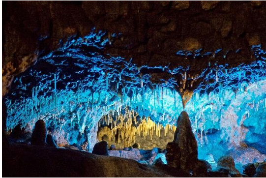
Seitengang_@Tropfsteinhoehle Schulerloch, Fotograf Christian Hoffmann - Gruppenreisen 2024