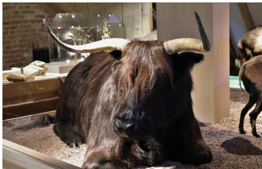
Steinzeit Museum Landau_IMG_4873_