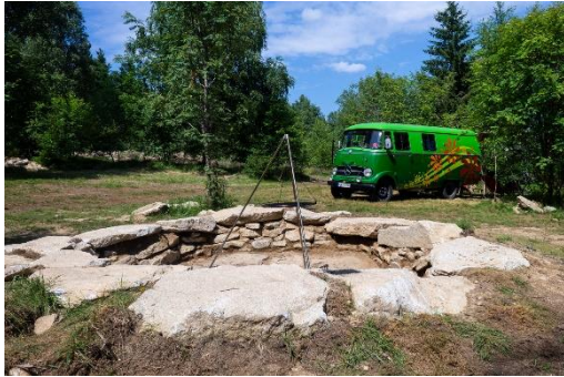
Campen mitten in der Natur