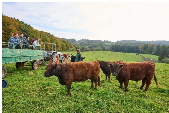
Galloway-Safari_Garnecker Hof_LK Rottal-Inn