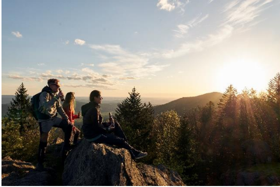
Biergenuss auf dem Bierfernwanderweg