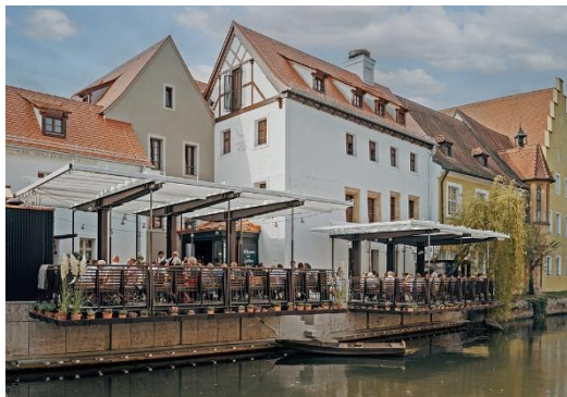
Entspannen im Bootshaus Amberg

Mauth/Finsterau (tvo). Campen wie früher, noch bevor es Glamping gab: Im idyllischen Dorf Finsterau am Rande des Nationalparks Bayerischer Wald liegt der Campingplatz Anderswo. Seit den 1970er Jahren schon machen ruhesuchende Naturfreunde hier Urlaub. Die Anlage wurde in den letzten Jahren nach nachhaltigen Prinzipien modernisiert und ist mit dem europäischen Nachhaltigkeitssiegel EU Ecolabel zertifiziert. Mit kleinen wie großen Maßnahmen versucht die Betreiberfamilie Lorenz, so ökologisch und ressourcenschonend wie möglich zu wirtschaften. Erneuerbare Energien liefern warmes Duschwasser und eine Photovoltaikanlage den Strom. Es werden nur die benötigten Flächen gemäht, der Rest gehört der Natur. Die Wege sind durchlässig geschottert, so dass Wasser bestmöglich absickern kann. Die Stellplätze haben alle unbehandelten Wald- und Wiesenboden. Es gibt sie mit oder ohne Strom und – für alle, die besonders ruhig wohnen wollen – direkt am Waldrand mit Blick auf den Nationalpark Bayerischer Wald. Abenteuerer buchen sich ein Plätzchen im Bereich „Into the Wild“. Das sind kleinere und größere Nischen inmitten wilder Natur für Zelte, Autos, Geländewägen mit Dachzelten sowie Busse und Vans. Das Zentrum bildet eine Lichtung mit einer festen Feuerstelle, an der man abends gemeinsam mit den Nachbarn sitzen oder grillen kann. Preise und Buchung unter www.anderswo-camp.de .