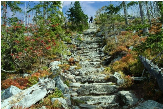
Himmelsleiter am Lusen, Etappe 17

Speisen und Getränke genießen und die Atmosphäre mit Live-Musik von Bands wie Furunkulus und Totus Gaudeo erleben. Feldschlachten und Waffenschauen der Lager sind ebenfalls Teil des Programms. Höhepunkte sind das Feuermärchen "Die Saga um den Feuerberg", ein spektakuläres Feuerschauspiel, sowie das Thema "Schwert gegen Degen" mit Fechtvorführungen und der Möglichkeit, gegen den Fahnenträger der Olympischen Spiele zu fechten. Sportliche Aktivitäten wie Axt- und Speerwurfturniere sowie Wikingerschach-Turniere bieten eine weitere Möglichkeit, sich zu messen und Preise zu gewinnen. Für Besucher, die es ruhiger mögen, gibt es verwunschene Pfade im Elfenhain, wo Märchenwesen und Künstler darauf warten, entdeckt zu werden. Zusätzlich kann man mit vergünstigtem Eintritt zum Wildpark am Schloss Ortenburg wechseln. www.ortenburger-ritterspiele.de