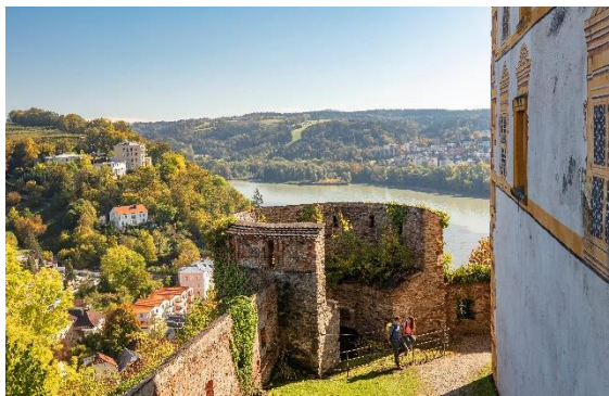
Donau Panoramaweg Lkrs PA Veste Oberhaus 13, © Tourismusverband Ostbayern e.V., Fotograf Stefan Gruber