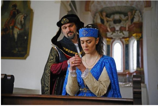
Herzog AlbrechtIII_Agnes Bernauer(c)Agnes-Bernauer-Festspielverein, Jürgen Sperl