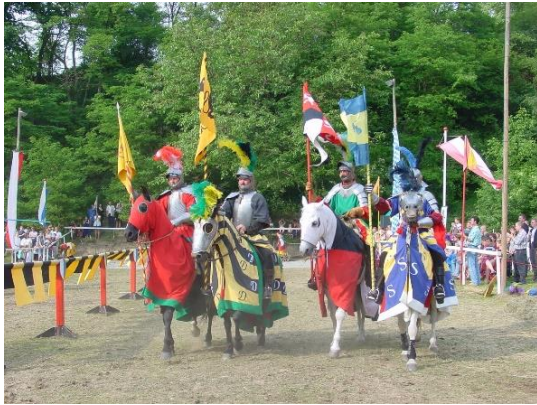
Ritterspiele Ortenburg